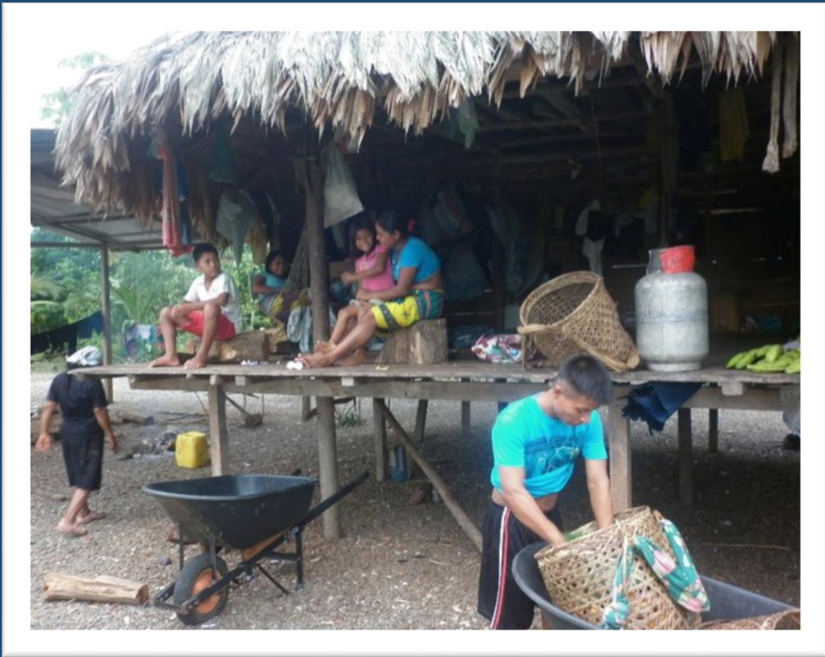
Bahía Piña.